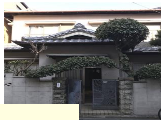
KISA2隊の活動拠点 1F きたつランド 2F 事務所 (生野区 北巽地域)