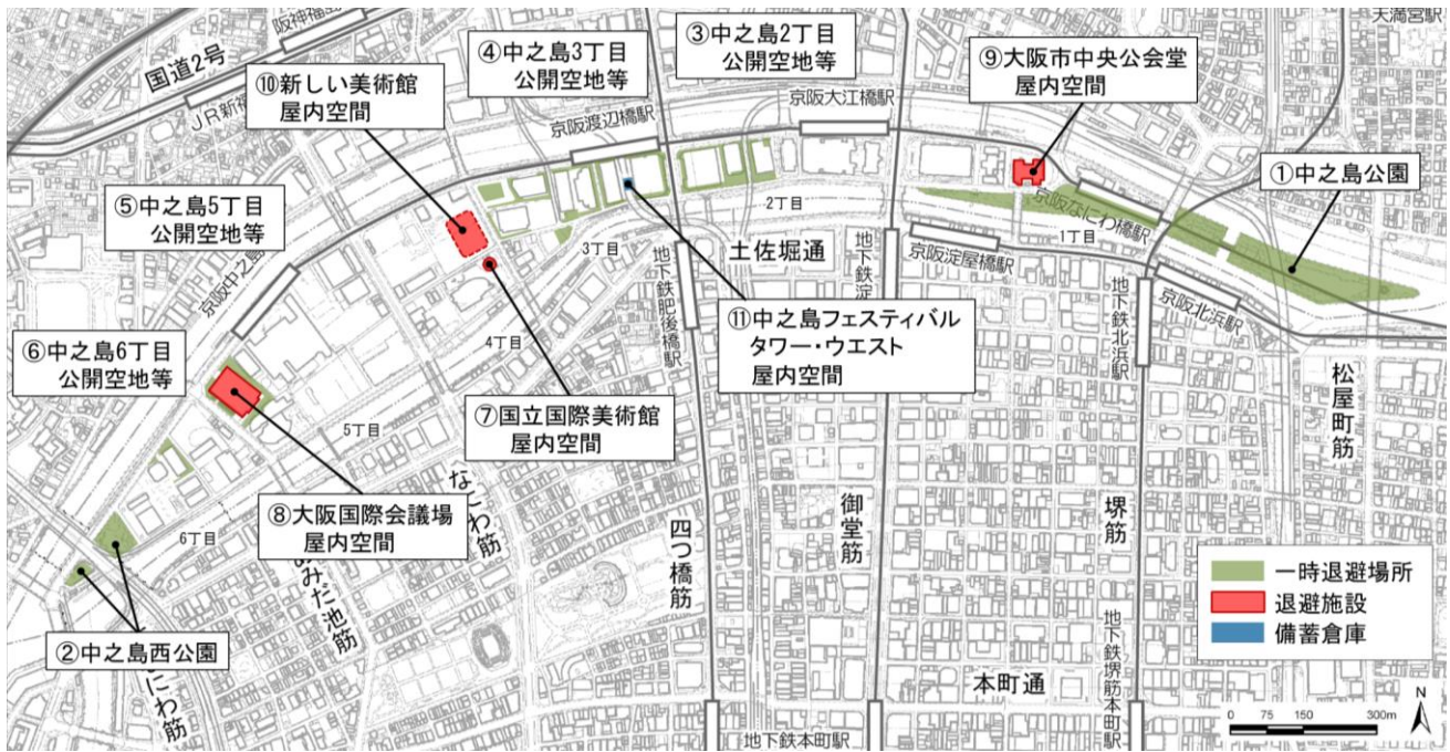
図 都市再生安全確保施設