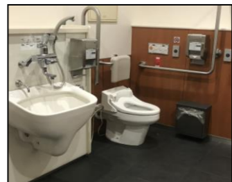
B. 大阪メトロ 関目高殿駅 (改札内)