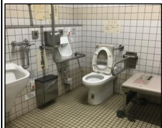
C. 大阪メトロ 関目成育駅 (改札内)