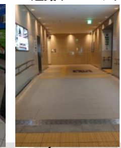
阪堺電車の改札及び歩道橋につながるEV