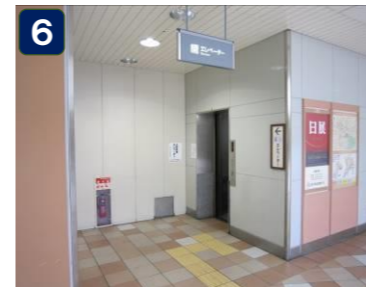
天王寺公園及び大阪メトロ谷町線天王寺駅南改札(地下2階)につながるEV