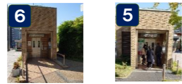
地上階(天王寺公園)