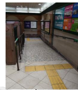
阪堺電車方面への通路(スロープ)