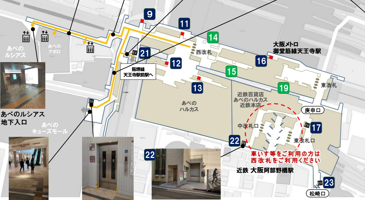
あべのルシアス地下入口