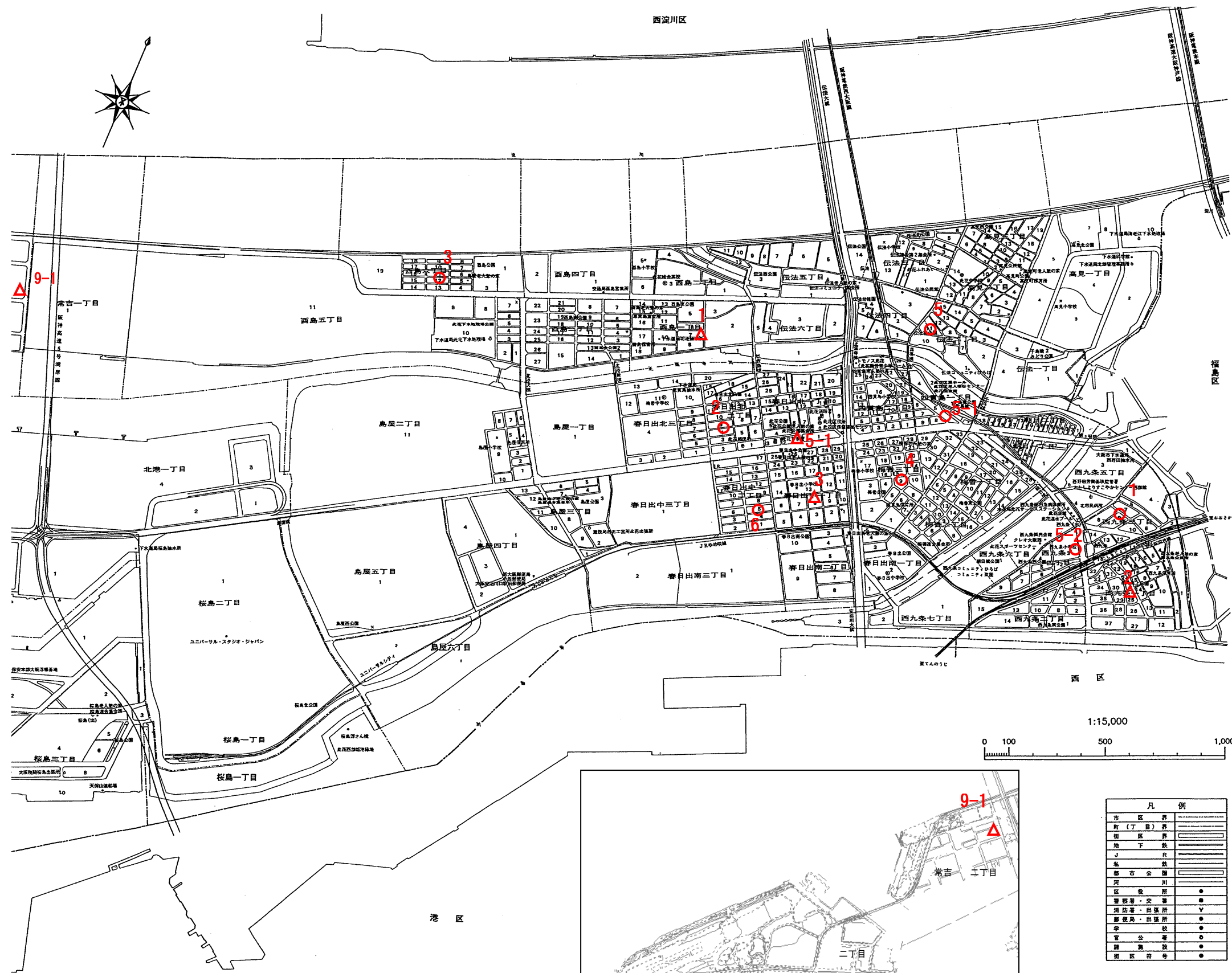
此花区標準地(○)価格表 (令和8年1月1日時点)