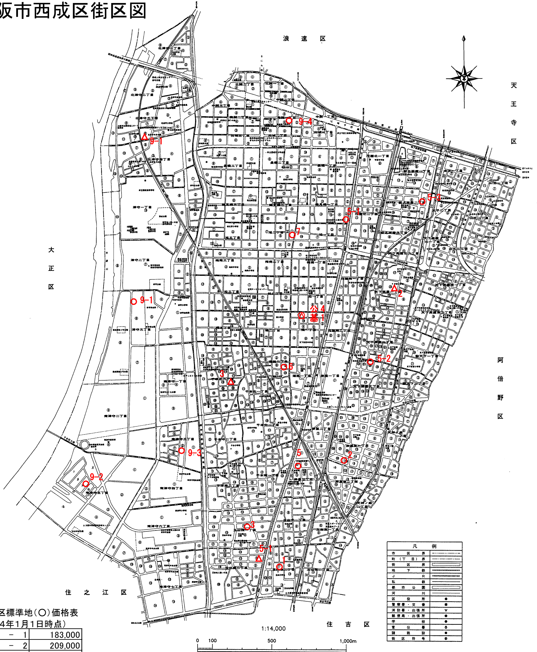
西成区標準地(○)価格表 (令和4年1月1日時点)