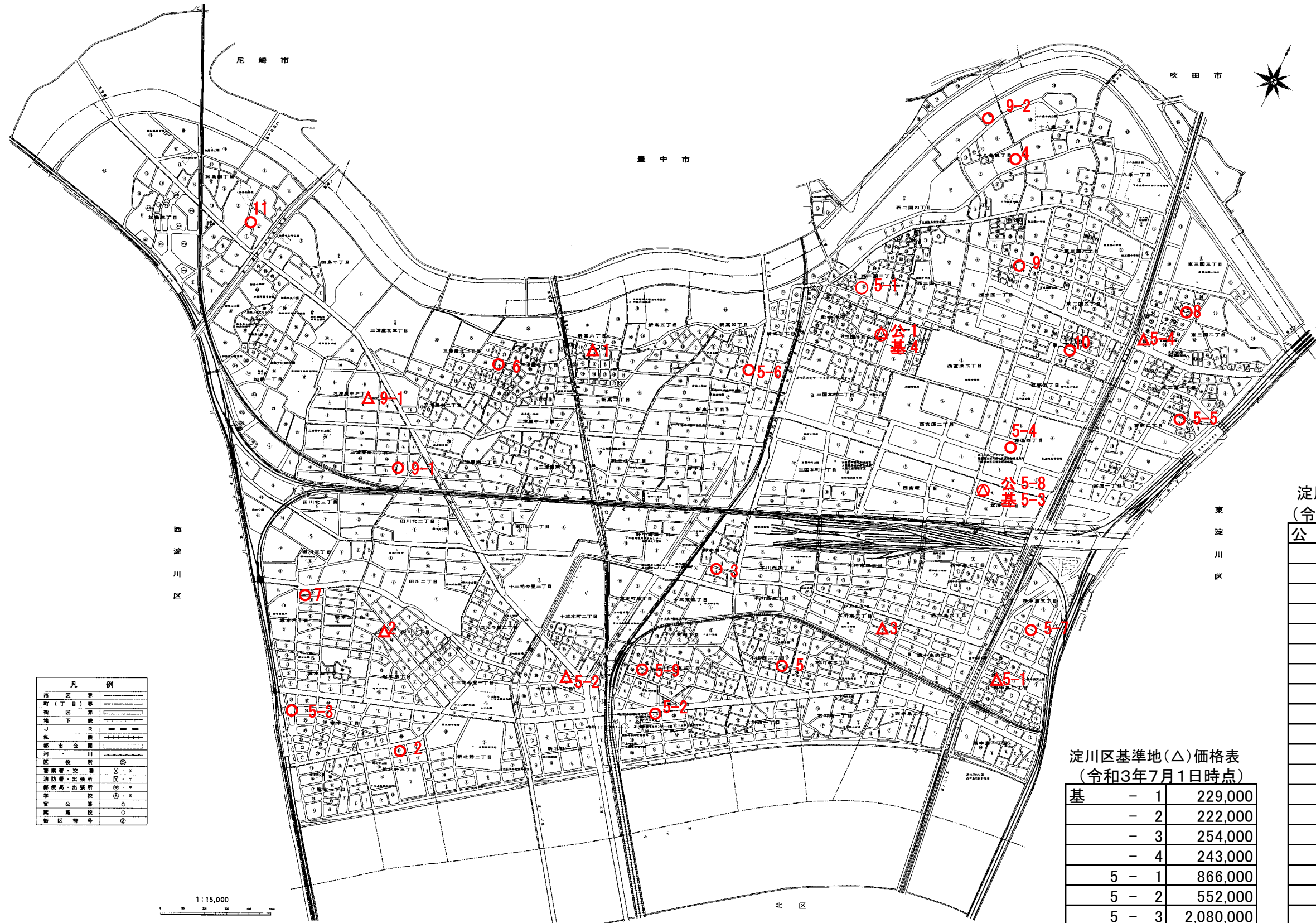
淀川区標準地(○)価格表 (令和4年1月1日時点)