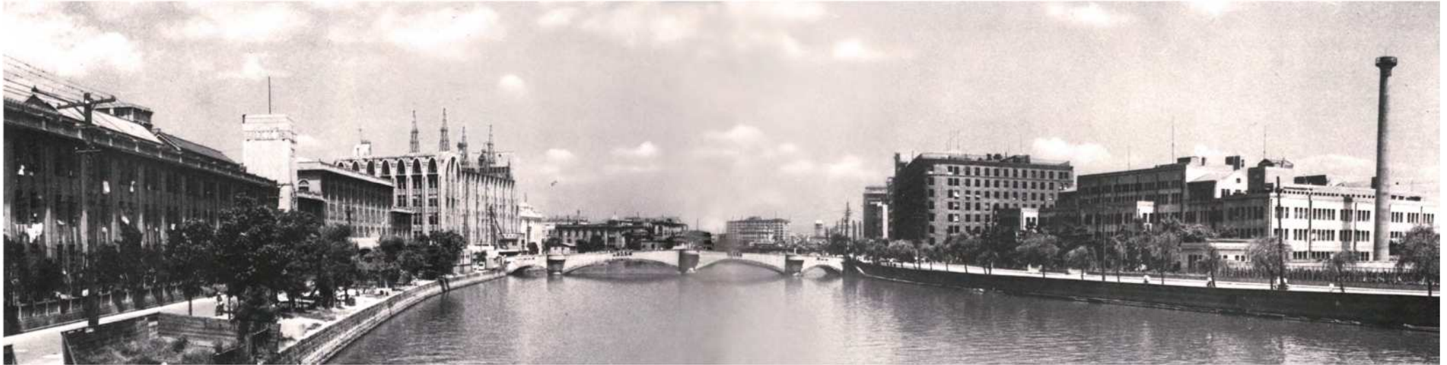
堂島川をはさんで、医学部附属病院(左)、医学部(右)、中央は田蓑橋

1931年に、大阪府立医科大学を母体として、医学部と理学部の2学部からなる大阪帝国大学を創設しました。