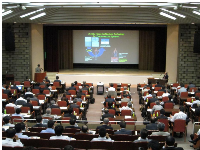
例会での医療現場ニーズ発表