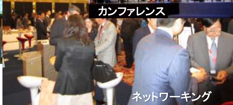
ネットワーキング