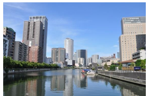
堂島川・大川 (天満橋から船津橋まで)