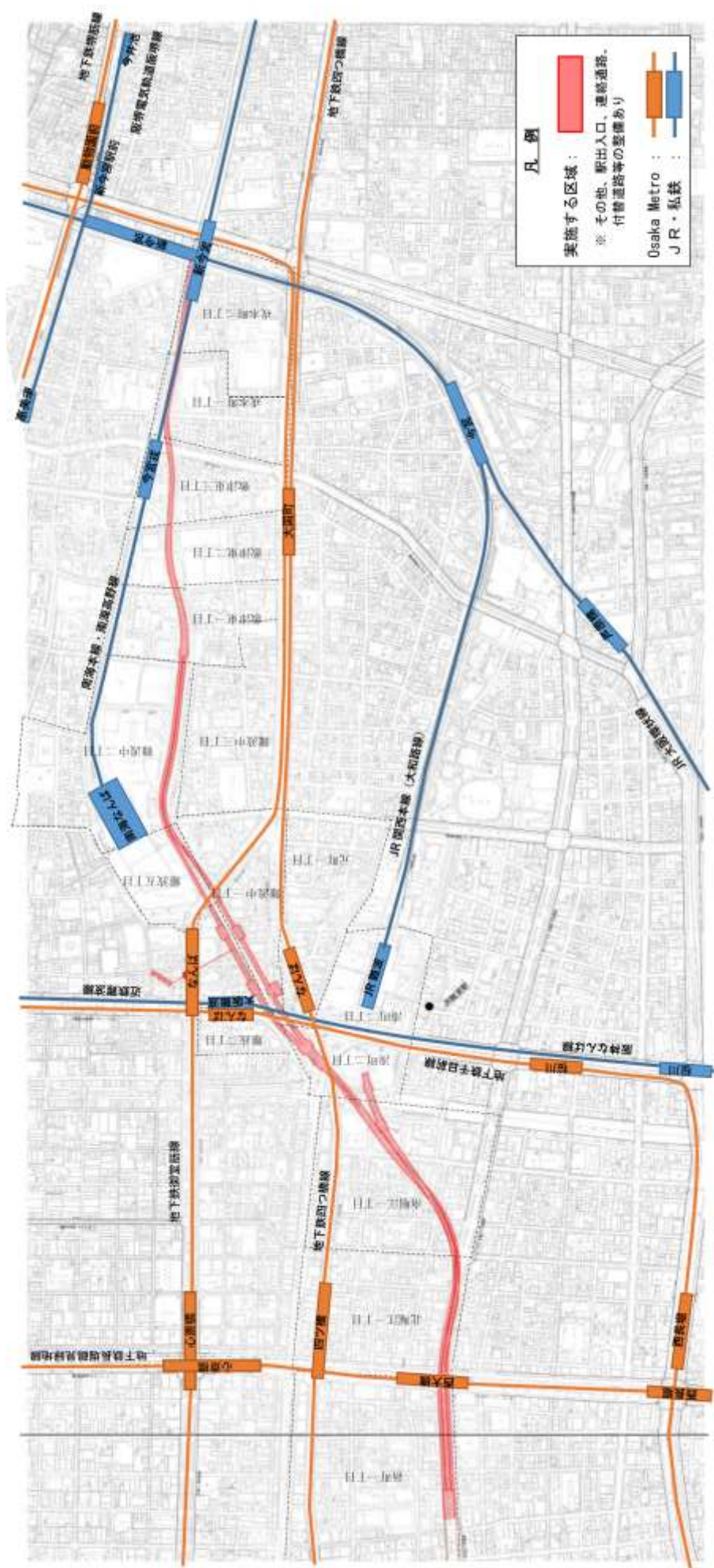
図 2-3 地域公共交通利便増進事業を実施する区域(詳細)2/2