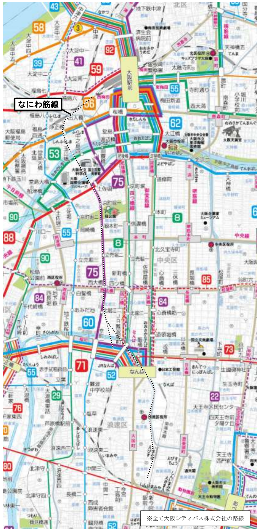
図 2-4 事業を実施する区域周辺のバス路線