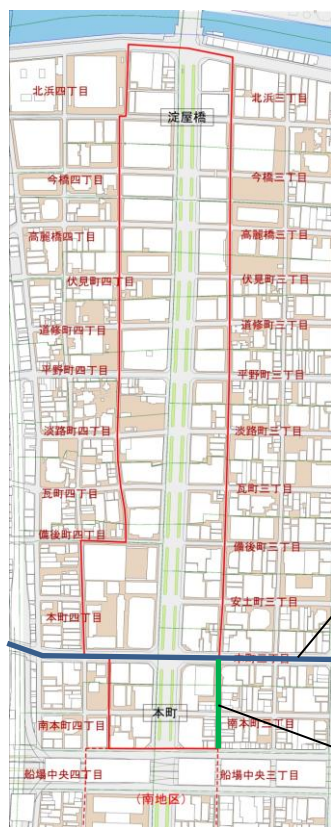
<御堂筋本町北地区>