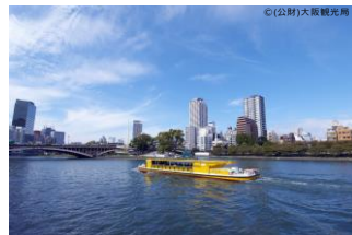
中之島の見渡す眺め