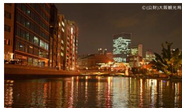
中之島（土佐堀川）の夜景