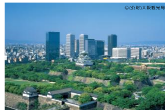
大阪城天守閣への眺め