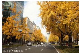
御堂筋の見通す眺め