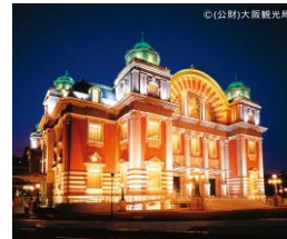
中央公会堂の ライトアップ