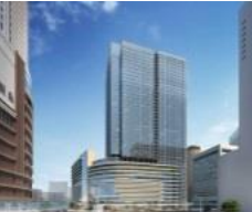
【完成イメージパース】