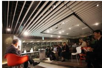
【ナレッジ・キャピタル イベント風景】