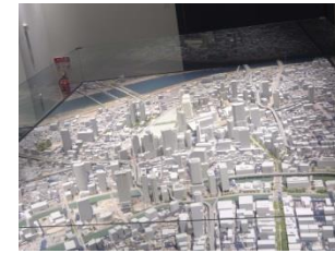
【グランフロント大阪 大阪駅周辺地域模型】