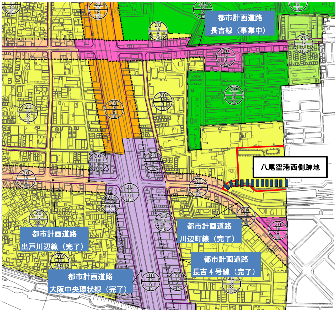
都市計画関連 凡例