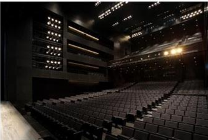
サンケイホールブリーゼ 7F