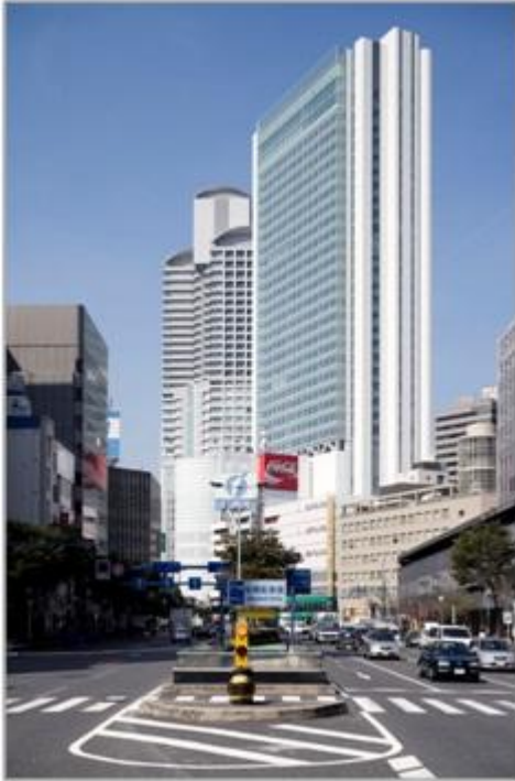
ブリーゼタワー 外観