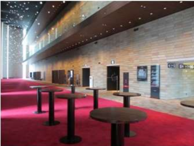
フェスティバルホール ホワイエ