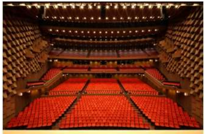
フェスティバルホール