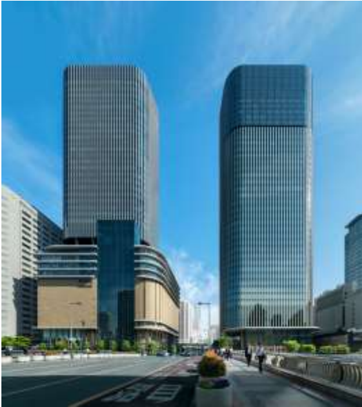
中之島フェスティバルタワー