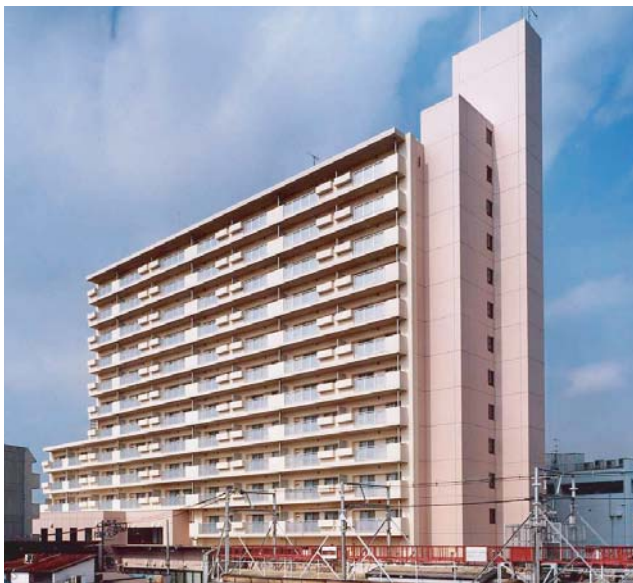
住宅市街地整備総合支援事業 (従前居住者用住宅) 平成15年7月竣工