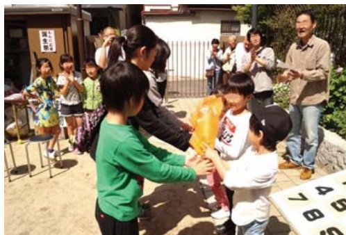
「ももに広場」は地域住民が自主的に管理・運営を行い、様々なイベントの企画・実施等を通して地域防災力（共助力）が育まれている

今後、まちかど広場づくりを進めていくために、地域内の土地所有者の方々にご協力いただきながら用地確保を検討していきたいと考えています。