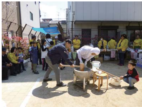
民間の所有者から土地を無償提供いただき、大阪市が整備した「まちかど広場（ももに広場）」

広場の計画段階から、地域のみなさまによるワークショップにおいて意見を出しあっていたいただき、整備後も自主的に管理運営をして頂くことで、地域防災力の向上と地域コミュニティの活性化をめざしています。