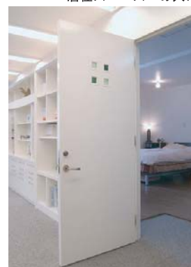
居住スペースへの入口