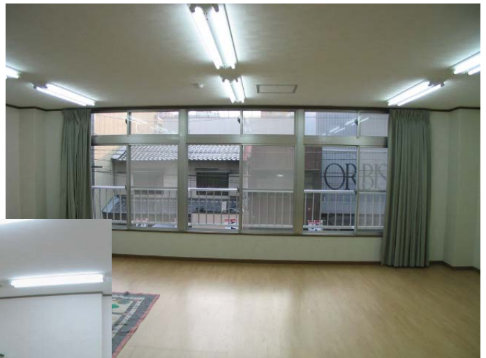
コミュニティルーム