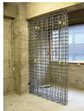
耐震壁による耐震補強