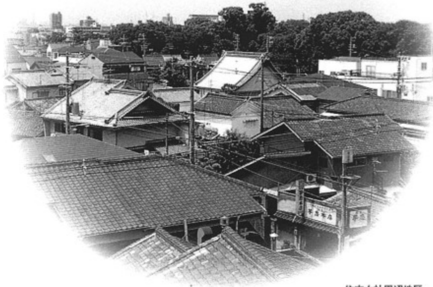
住吉大社周辺地区

歴史的・文化的雰囲気を備えた住吉の魅力あるまちなみづくりを進めていくために、ひとりでも多くの方々にこの「まちなみガイドライン」を利用していただきたいと思えます。