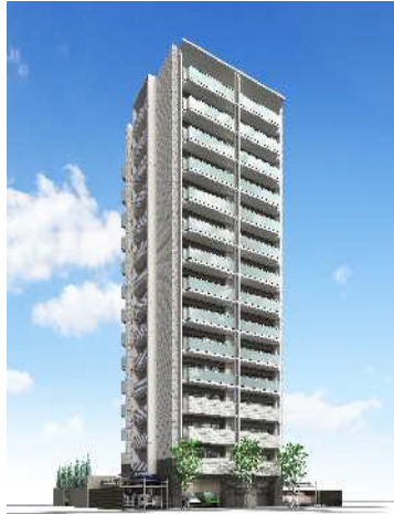
【外観イメージパース】

(計画認定：平成 24 年 12 月 7 日) (変更計画認定：平成 26 年 2 月 27 日) (認定：平成 26 年 3 月 17 日)