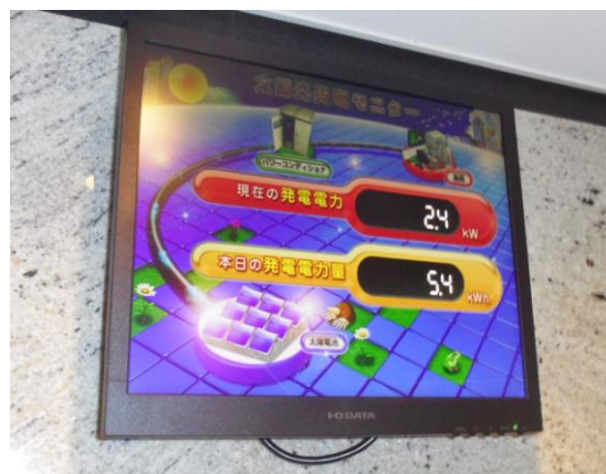
居住者の環境意識を高める設備