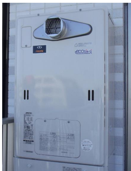
給湯設備：潜熱回収型給湯器（エコジョーズ）