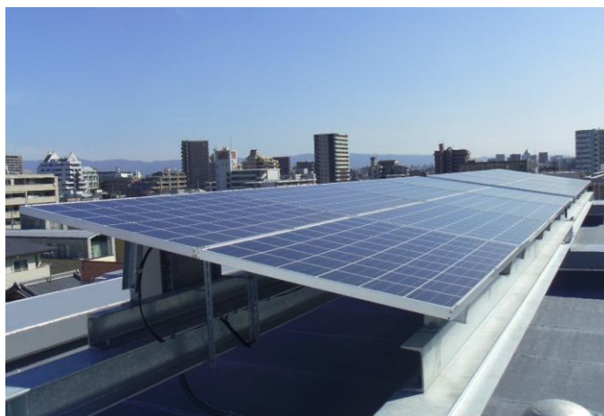
エネルギーを創出する設備：太陽光発電システム