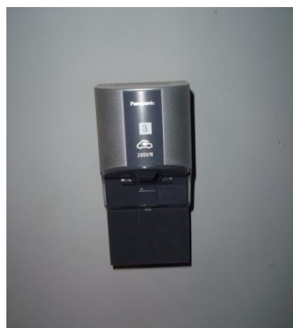
居住者の環境意識を高める設備