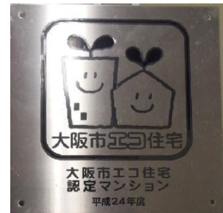
「大阪市エコ住宅」認定プレート