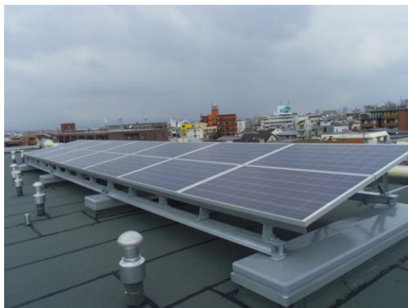
エネルギーを創出する設備：太陽光発電システム