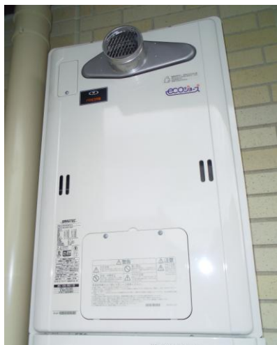
給湯設備：潜熱回収型給湯器（エコジョーズ）