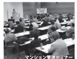
マンション管理セミナー