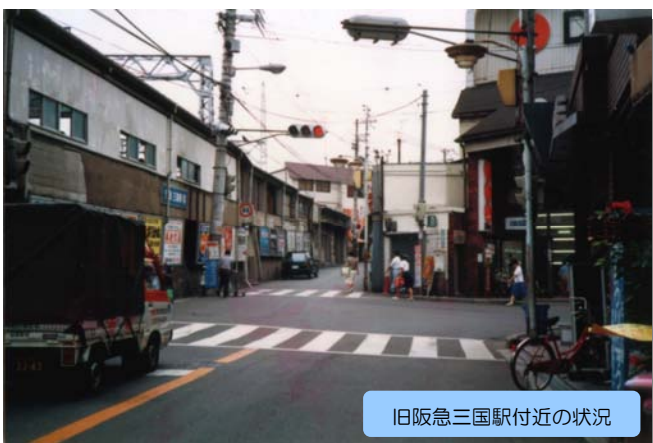
旧阪急三国駅付近の状況