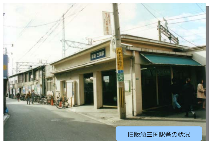
旧阪急三国駅舎の状況