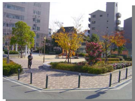
整備後（新高東公園）