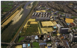
当地区におけるスーパー堤防整備状況

当地区においては、地区南部を流れる大和川の堤防整備と区画整理事業による堤防周辺地域の整備が一体となり、スーパー堤防の整備を進めています。これによって、地区の洪水に対する安全性をよりいっそう高めるとともに、河川空間と都市空間の調和のとれた憩いと安らぎを与える場となることでしょう。