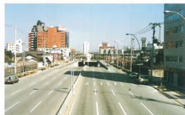
歌島豊里線と東海道本線との立体交差