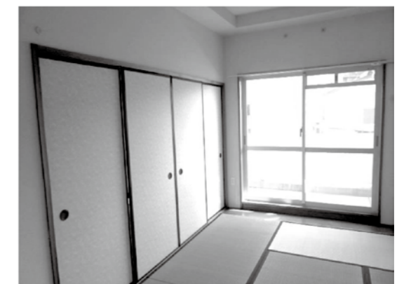
〈 和室 〉