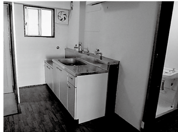
〈 台所 〉