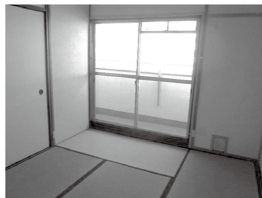
〈 和室 〉

市営住宅の標準的な室内イメージをご紹介します。 建設年や住宅の違い等により、設備の内容は異なります。 必ずしも現況がこの通りになっているとは限りません。