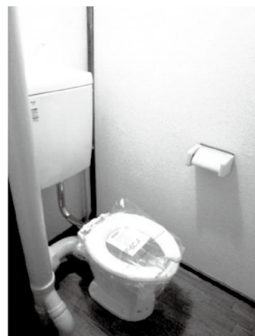
〈 便所 〉