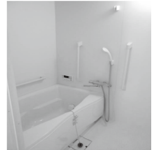
〈 浴室 (浴槽有) 〉