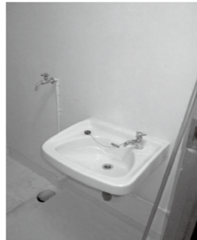
〈 洗面 (浴室内) 〉