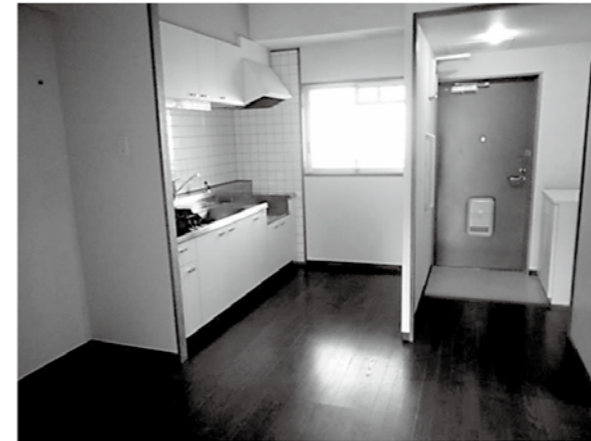
〈 台所 〉