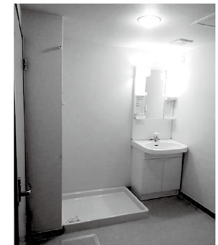
〈 洗面 〉