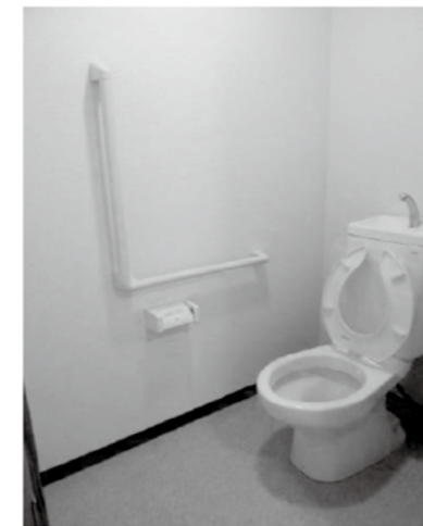
〈 便所 〉