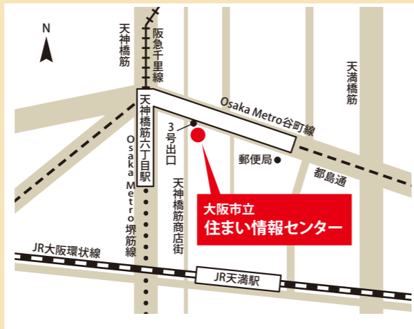
Osaka Metro谷町線・堺筋線、阪急電鉄「天神橋筋六丁目駅」3号出口直結 JR大阪環状線「天満駅」から北へ約650m

〒530-0041 大阪市北区天神橋6丁目4-20 営業時間：平日・土曜 9時～19時、日曜・祝日 10時～17時 休館日：火曜（祝日の場合は翌日）、 祝日の翌日（日曜・月曜の場合は除く）、年末年始 上記休館日のほか、臨時休館や特別に開館する日があります。