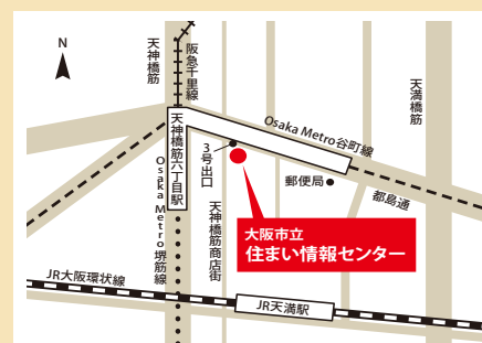
Osaka Metro谷町線・堺筋線、阪急電鉄「天神橋六丁目」3号出口直結 JR大阪環状線「天満駅」から北へ約650m