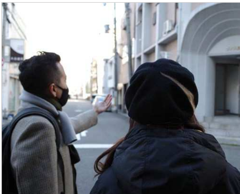
2021年度 まちあるき調査の様子 in 港区(築港地区)

建築を発見し、共感する力によって「わたしの生きた建築」から、「わたしたちの生きた建築」に発展させるこのプログラムに、ぜひご参加ください。 詳しくは裏面をご覧ください。