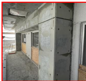
▲ コンクリートの施工