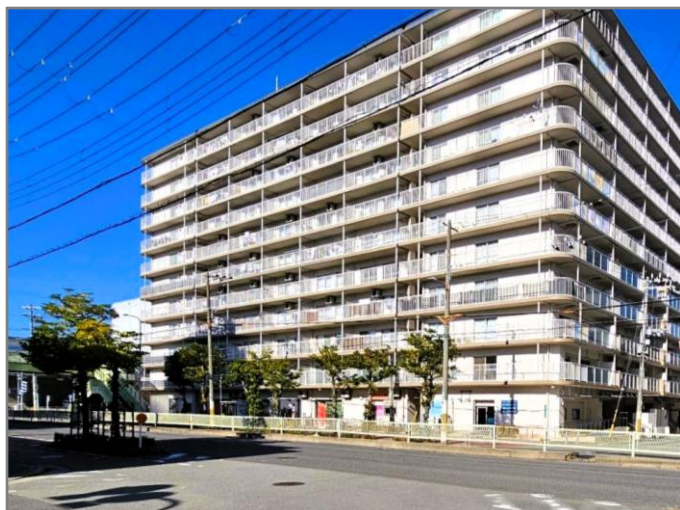
▲ 耐震改修が目立たない仕上がりの外観