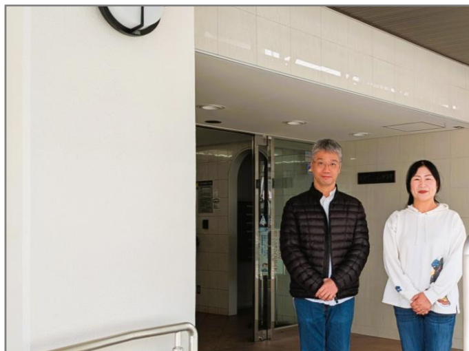
▲ 修繕委員長と理事長(左側は補強後の柱)