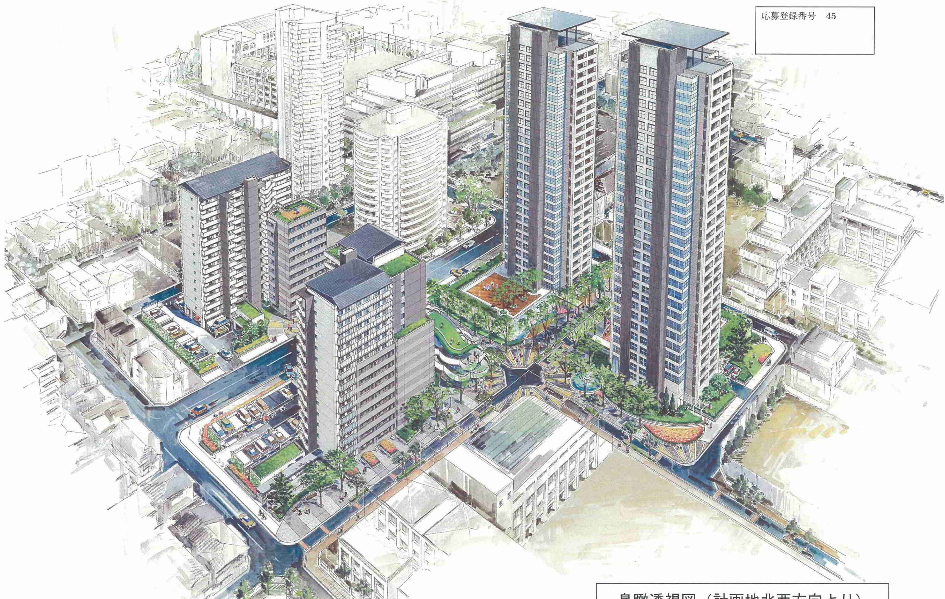
鳥瞰透視図（計画地北西方向より）