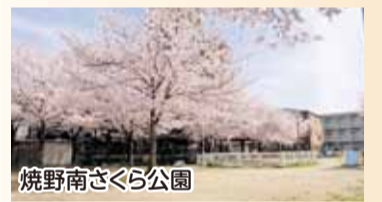
焼野南さくら公園