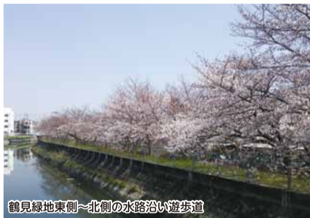
鶴見緑地東側～北側の水路沿い遊歩道

3月末～4月にかけて、鶴見緑地をはじめ、区内のさまざまな場所で桜が美しく咲き誇りました。