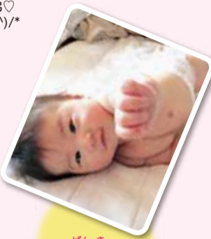
野口 源喜ちゃん(6か月) 私達の「喜びの源」源喜くん！むちむち☆ダイナマイトバディー！！