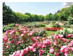
秋の駒公園バラ園の様子

バラの名所として親しまれている市内の4つのバラ園で、開花に合わせてローズツアーや講習会を開催。①場駒公園バラ園 日10/15(土)・16(日)、10:30~、14:00~ 問大阪城公園