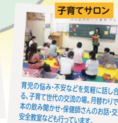
育児の悩み・不安などを気軽に話し合える、子育て世代の交流の場。月替わりで絵本の読み聞かせ・保健師さんのお話・交通安全教室なども行っています。