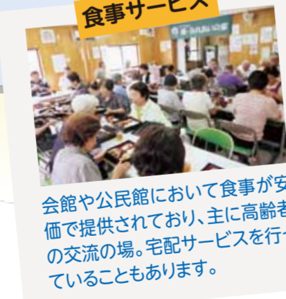
会館や公民館において食事が安価で提供されており、主に高齢者の交流の場。宅配サービスを行っていることもあります。