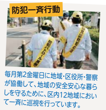
毎月第2金曜日に地域・区役所・警察が協働して、地域の安全安心な暮らしを守るために、区内12地域において一斉に巡視を行っています。