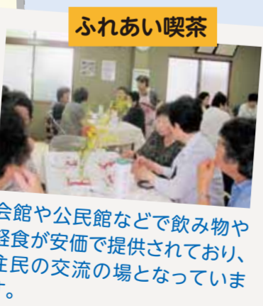
会館や公民館などで飲み物や軽食が安価で提供されており、住民の交流の場となっています。