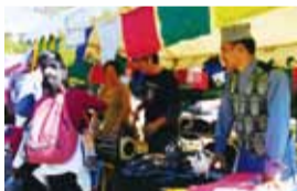
▲ワールドフェスタ

地域・区・関係機関と協働し、区の魅力を感じることができるイベントや環境意識を高める取り組みを進めています。