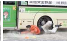
▲スケアードストリート学習