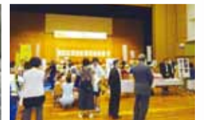
▲健康まつり&食育フェスタ