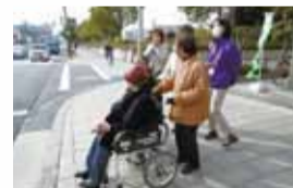
▲有償ボランティア事業(あいまち)

だれもが健康で安心して暮らせるように、高齢者・障がい者に優しいまちづくりや、区民の生活習慣の改善・健康増進の取り組みを進めています。