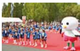
▲青少年カーニバル