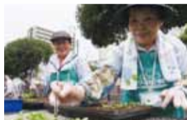
▲種花ボランティア