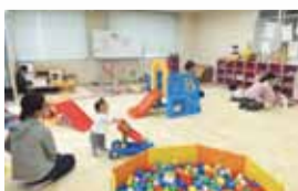
▲つるみっ子ルーム

安心して子育てできる環境づくりや、次世代を担う子ども・青少年が将来への夢を膨らませ、健やかに成長できるよう、地域や学校、企業と連携した取り組みを進めています。