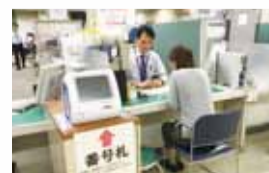
▲3階窓口リニューアル

区の実情や特性に応じた区政運営をめざし、区民ニーズの把握や積極的な広報をはじめ、窓口サービスの向上を図っています。