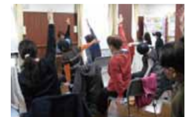
▲トレーニングハウス