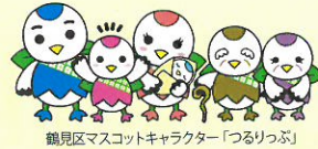
鶴見区マスコットキャラクター「つるりっぷ」