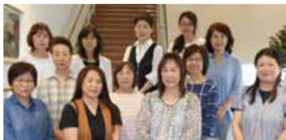
▲つなげ隊のみなさんの写真

鶴見区社会福祉協議会 〒538-0051 鶴見区諸口5丁目浜6-12 鶴見区在宅サービスセンター内 ☎6913-7066 受付時間:月曜日～金曜日 9時～19時 土曜日 9時～17時30分