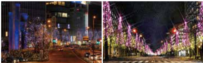
御堂筋イルミネーションの写真(イメージ)