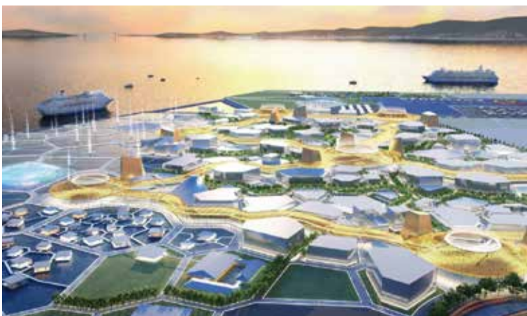
夢洲から南西を望む夕景の会場鳥瞰図。淡路島、明石海峡大橋を背景に、美しい景観が広がります。(会場面積:155ha)