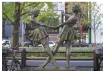
沿道企業等の寄付による彫刻(全29体)