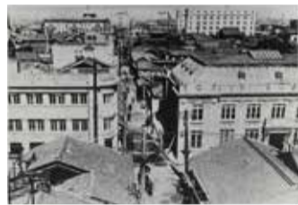
拡張前(幅6m)の淀屋橋筋(現御堂筋)

御堂筋は、大正時代に拡幅が計画され、昭和12年(1937年)に現在の幅44m、長さ4kmの大幹線道路として誕生しました。日本で2番目となる地下鉄を道路の下に開通させ、イチョウ並木の街路樹を配し、沿道ビルへは高さ制限を行うなど、徹底して景観にこだわり、大阪が世界に誇る美しいメインストリートとなりました。今後、時代とともに変化する市民のニーズに対応し、新たな御堂筋へと進化していきます。