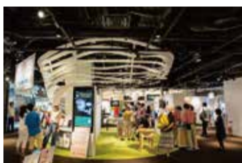
▲多彩な技術やアイデアが集う「ナレッジサロン」や、来場者参加型の展示空間「The Lab. (ザ・ラボ)」では、これまで次世代電気自動車などが商品化されてきました。

問い合わせ 都市計画局うめきた整備担当 ☎6208-7838 FAX6231-3751