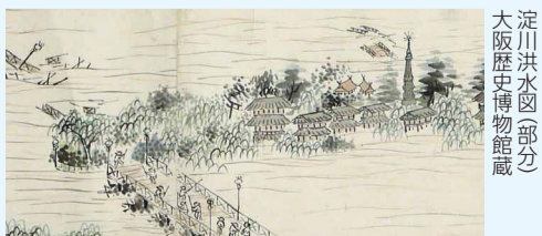
淀川洪水図(部分) 大阪歴史博物館蔵

日 6/25(月)まで9:30~17:00(入館は16:30まで) 火曜休館 場 問 大阪歴史博物館 ☎6946-5728 FAX6946-2662