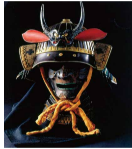
三十二間総覆輪阿古陀形筋兜 [大阪城天守閣蔵]

天守閣の収蔵品の中には、さまざまな「顔の表現」のあるものが含まれます。目を凝らさないとわからないような細かい技巧、見るものの心に働きかける豊かな表情など、多種多様な顔が見られる資料を集めました。日7/19(木)まで9:00~17:00(入館は16:30まで) 場問大阪城天守閣 ☎6941-3044 FAX6941-2197